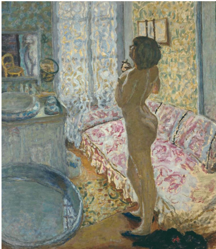
Pierre Bonnard , Nu à contre-jour , 1908 MRBAB-KMSKB, Bruxelles