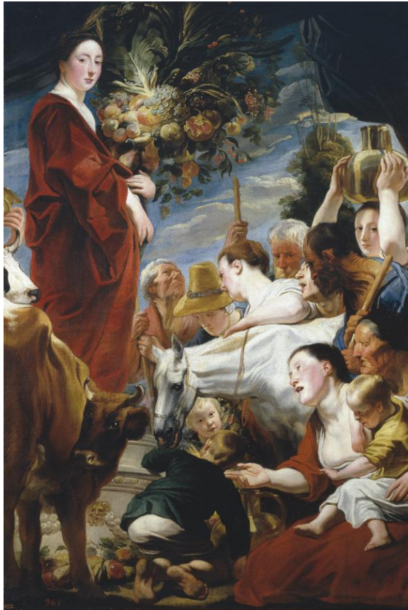
Jacob Jordaens, Offrande à Cérès

Cette exposition propose une toute nouvelle approche de l'œuvre de Jordaens. Grand rival de Rubens, Jordaens ne se limitait pas à peindre de simples scènes de genre. On lui doit également des scènes saisissantes de la mythologie et de l'antiquité classique. Plus de 80 peintures et dessins, tapisseries et sculptures, provenant de célèbres musées et de collections privées, d'Espagne (Museo Nacional del Prado, Madrid), du Danemark (Statens Museum for Kunst, Copenhague), de Grande-Bretagne (Glasgow Museum and Art Gallery) et d'Autriche (Albertina, Vienne) seront complétés par les chefs-d'œuvre du maître anversois, conservés à Bruxelles et Kassel.