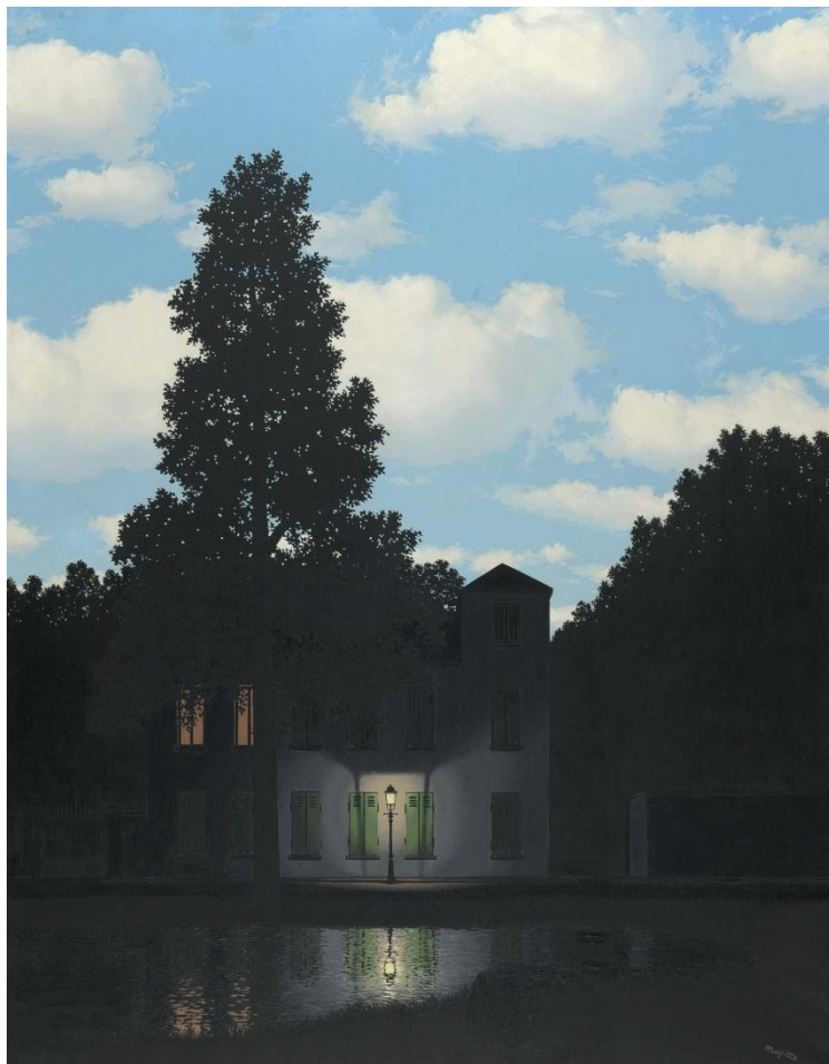
René Magritte, L'Empire des lumières , 1954